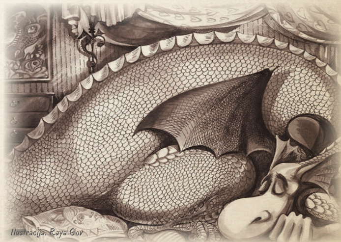
Ilustracija: Raya Gov

niso verjeli, drugi so bili preveč nemirni, da bi lahko našli zmaje. Nekateri pa so jih našli. Predvsem otroci. Ker so znali prisluhnuti in verjeti. In čisto počasi se je zemlja začela spreminjati. Postajala je manj hrupna. Bolj prijetna. Tudi bolj močna in zdrava. In mogoče, kdo bi vedel, bodo nekoč zmaji prišli nazaj. Tako malo. Na obisk. K novim prijateljem.